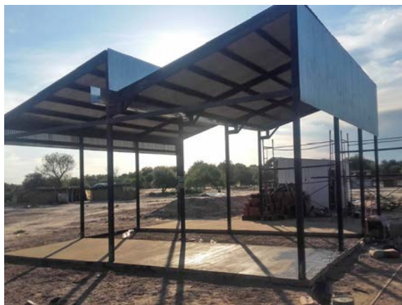
Struttura El Pelicano