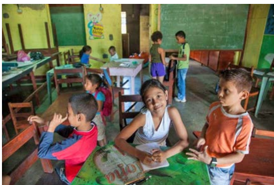
Scuola Sagrada Familia

In Nicaragua, Domus sostiene il Centro Educativo Sagrada Familia nel comune di Ticuantepe facente parte del dipartimento di Managua. Nel Centro è presente la scuola materna e la scuola primaria, con un numero di circa 200 alunni. I programmi sono basati sul programma nazionale ma con metodologie attive. La scuola materna si svolge seguendo il metodo Montessori. L'obiettivo è di fornire un'istruzione di qualità che permetta agli studenti di imparare a leggere correttamente e fluentemente, con anche l'inserimento della lingua inglese, sviluppando l'amore dell'apprendimento e il desiderio di miglioramento personale e familiare. In questo momento storico di grande difficoltà legata alle condizioni storiche e socio-economiche del Paese-nazione, la Fondazione supporta l'Istituto per questo anno scolastico nella lotta per la sopravvivenza della struttura stessa, aiutandola a traghettare attraverso questo periodo di difficoltà enorme del Paese, verso la salvezza.