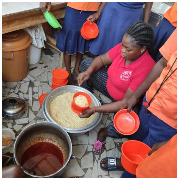
Mensa ad Amakpapè

Fra gli alunni, un centinaio di bambini, poverissimi, ha bisogno di aiuto anche per il cibo; la mensa è l'opportunità dell'unico pasto quotidiano; altri bambini vengono da piccoli villaggi distanti anche otto chilometri da percorrere a piedi e non possono rientrare a casa durante la pausa pranzo. La Fondazione ha ritenuto la richiesta più che meritevole e deciso di finanziare il progetto Mensa per l'anno scolastico 2022/2023.