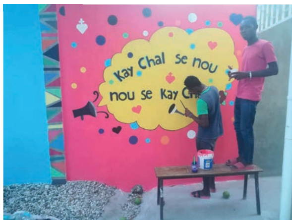
Il centro di aggregazione Kay Chal

Questi ragazzi, infatti, che continuano la loro attività di lavoratori domestici, hanno come unica retribuzione un pasto quotidiano e l'alloggio e le famiglie che li accolgono non intendono sostenere tali spese.