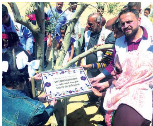
L'olivo dedicato a Vittorio piantato a Al Qatatwa - Striscia di Gaza

NAZRA (in arabo "Sguardo") è un Festival di cortometraggi che ha come obiettivo la promozione delle competenze artistiche e cinematografiche di giovani autori e autrici, palestinesi ed internazionali, che usano il linguaggio del cortometraggio per trattare temi quali la libertà, la giustizia, i diritti umani, l'autodeterminazione, nel delicato contesto israelo-palestinese. Mira inoltre a diffondere la conoscenza della situazione sociale e politica in Palestina, rimettendo al centro del dibattito pubblico la violazione dei diritti umani subita dal suo popolo. È promosso dalle organizzazioni Restiamo Umani con Vik (Venezia) , École Cinéma (Napoli) e Centro Italiano di Scambi Culturali-VIK (Striscia di Gaza - Palestina). La Fondazione ha concesso il proprio patrocinio al Festival con l'istituzione di un premio denominato "Vittorio Arrigoni Prize" da assegnare all'opera che, "pur narrando un contesto di occupazione e prevaricazioni, meglio rappresenti lo spirito di resistenza, le azioni positive, solidali e di emancipazione mirate alla promozione dei diritti umani universali in Palestina".