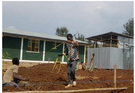
Inizio lavori fondamenta cucina e mensa a Laku (Etiopia)

“ Per volere la pace devo guardare intorno a me per vedere se tutti hanno il necessario, la gioia di vivere, la libertà di parlare, di lavorare, di pregare, di amare, proprio come me, che ho tutte queste cose e vivo bene, ogni giorno. ” (a nove anni)