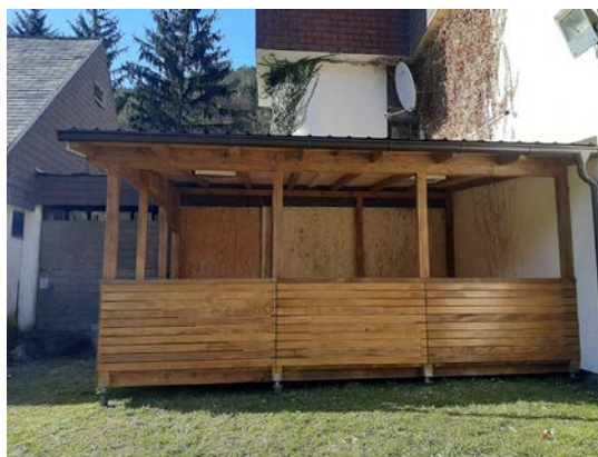
"Teen Corner" - Sedra

Ipsia BiH, Istituto Pace Sviluppo Innovazione Acli , attiva in Bosnia dal 1997 ci sottopone un progetto denominato "Angolo per i teenager (teen corner)". I beneficiari diretti sono cinquanta minori non accompagnati del campo TRC Sedra che, come previsto dagli obiettivi del progetto, parteciperanno in attività di gioco, sportive e sociali. Si tratta per lo più di minori non accompagnati e giovani del campo. Questa è la categoria che necessita maggiormente attività ricreative e sociali e che fruirà maggiormente di queste attività, che possono permettergli di esprimere la loro personalità, alleviare le sofferenze a livello mentale e creare legami di amicizia più profondi. La richiesta di Ipsia BiH, che la Fondazione ha deciso di sostenere, consiste nel finanziamento della costruzione di un gazebo in legno vicino al Social Cafè del campo profughi Sedra, nonché l'acquisto di una tavola da ping-pong e una da calcio balilla (biliardino), così da poter promuovere attività ricreative e creare l'opportunità di passare il tempo in attività strutturate. Poiché molti di questi giovani hanno attraversato differenti paesi e sono in viaggio da tantissimo tempo, lontani da famiglia e amici, è importante creare occasioni in cui possano distanziarsi dalle difficoltà che hanno incontrato, creando un ambiente sereno in cui relazionarsi con i coetanei in spazi postivi di interazione e comunicazione.