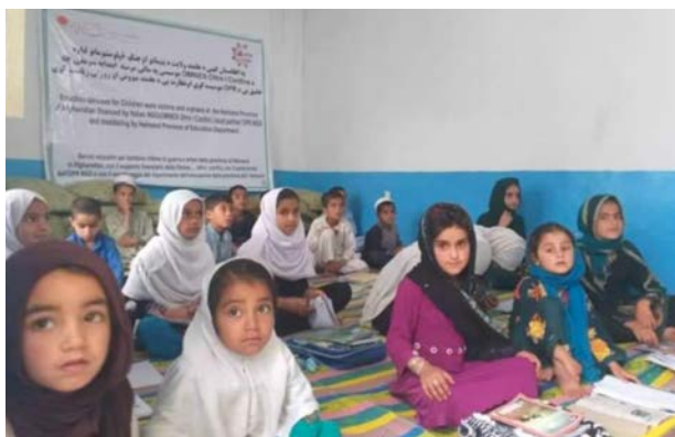
Scuola delle bambine e degli orfani di guerra

In Palestina a volte incontro gente locale che mi scrutava allibita chiedendomi perché diavolo non mi coprisi con giubbotti antiproiettili nel momento di sfilare dinnanzi ai tiratori israeliani. Proprio perché in pace, di pace eravamo vestiti e di nient’altro che potesse essere mai interpretato come emblema di guerra, aggressione, invasione.”